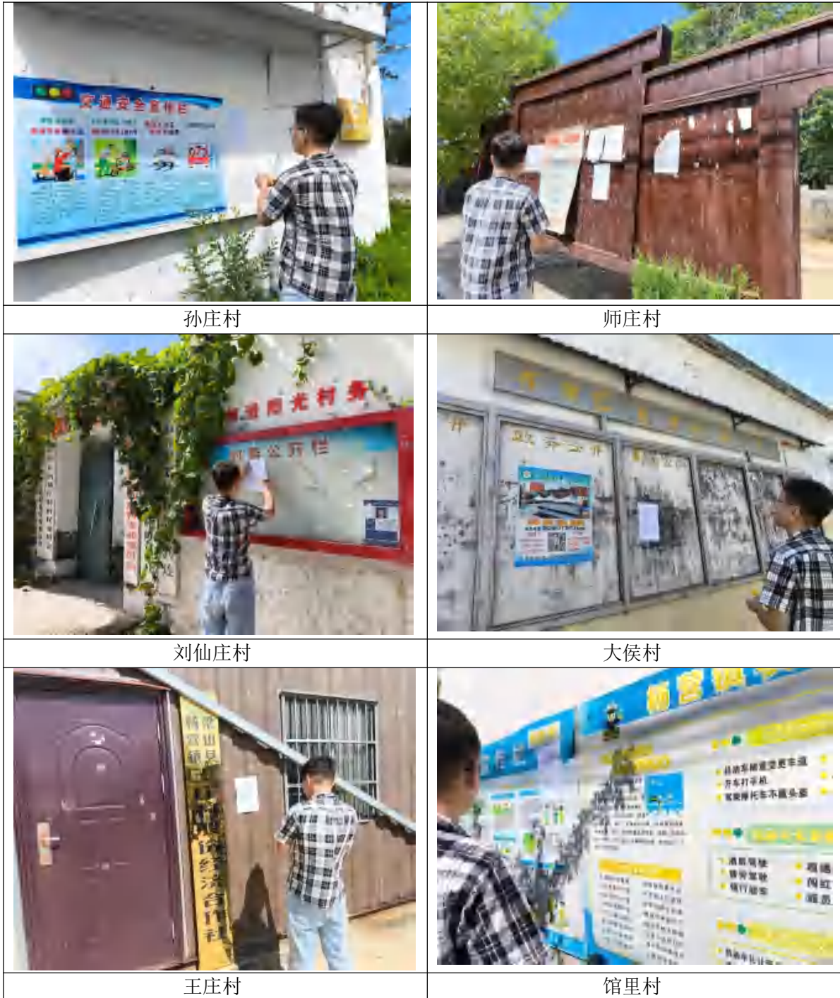
二次公示张贴照片

我单位于2024年9月4日至2024年9月23日在建设地点周边孙庄村、师庄村、刘仙庄村、大侯村、王庄村、馆里村等地张贴公告环评信息进行了公示，照片如下：